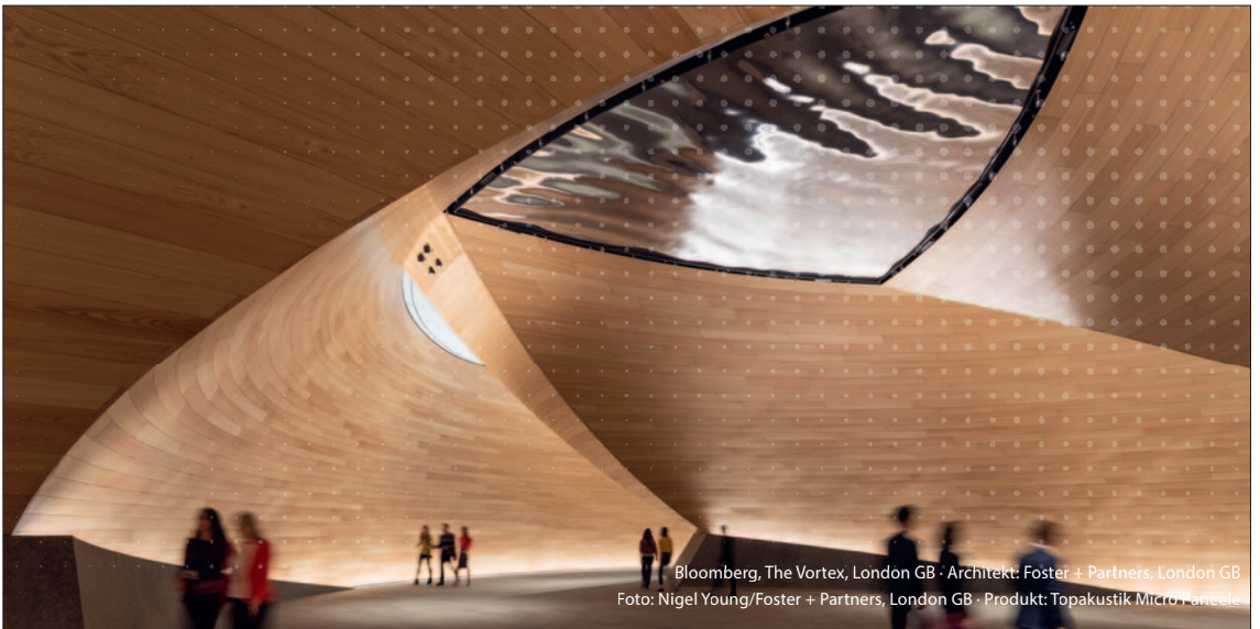
Bloomberg, The Vortex, London GB · Architekt: Foster + Partners, London GB Foto: Nigel Young/Foster + Partners, London GB · Produkt: Topakustik Micro Panels

Topakustik ist eine weltweit aktive Marke und Hersteller von schallabsorbierenden Decken- und Wandsystemen aus Holzwerkstoffen. Die Elemente werden auf modernen Anlagen nach den Vorstellungen unserer anspruchsvollen Kunden in Lungern OW produziert. Zur Ergänzung unseres Teams suchen wir per sofort oder nach Vereinbarung